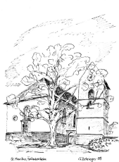
St. Mauritius Frei-Laubersheim