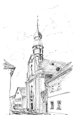
St. Josef und Ägidius – Fürfeld, Tiefenthal