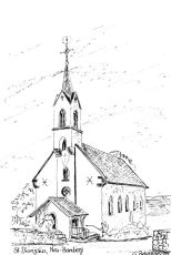
St. Dionysius Neu-Bamberg