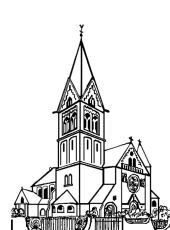
St. Remigius Wöllstein mit Eckelsheim und Gumbsheim