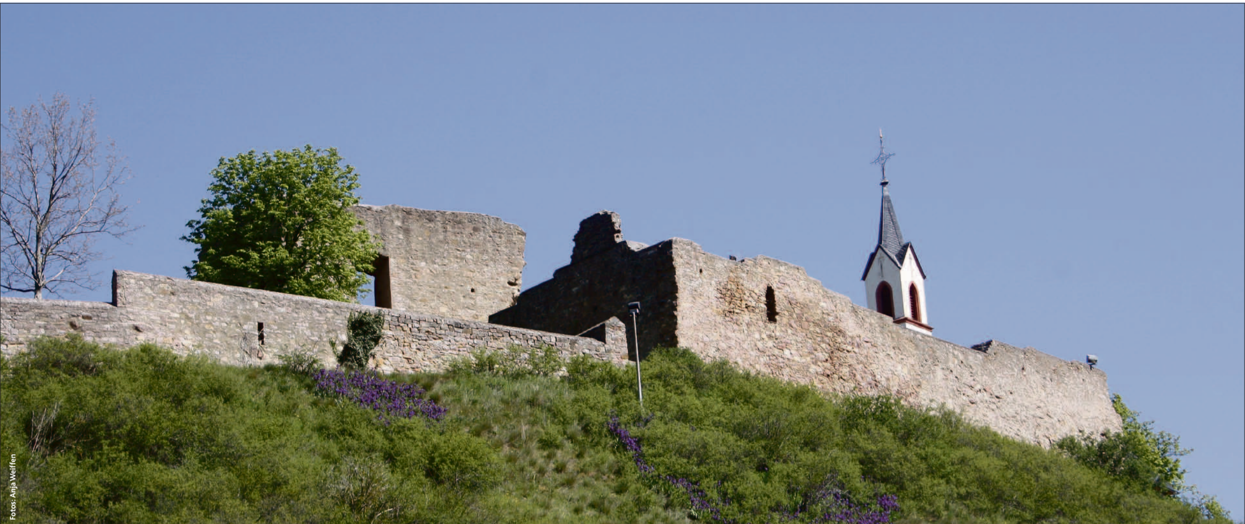
➤ Blick vom Ort Neu-Bamberg auf die Burgruine mit am Berghang blühenden Schwertlilien.